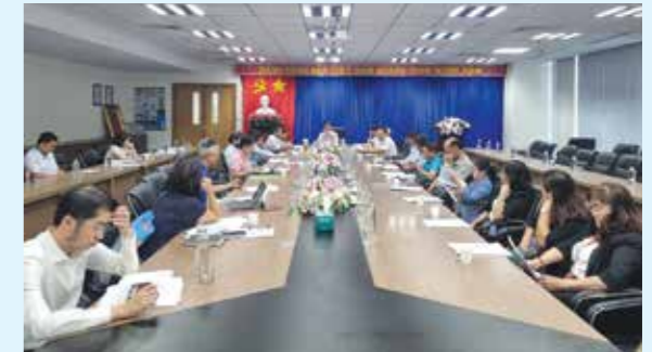
Sở Công Thương tổ chức buổi làm việc với các hiệp hội ngành hàng để nắm tình hình sản xuất, kinh doanh quý I/2023

Theo thông tin từ các Hiệp hội trong quý I/2023 tình hình của doanh nghiệp không mấy thuận lợi. Thị trường bất ổn do xung đột giữa Nga - Ukraine làm cho giá dầu tăng, lạm phát tăng mạnh ở nhiều quốc gia, suy thoái kinh tế khiến nhu cầu tiêu dùng giảm, ảnh hưởng đến các thị trường lớn như Mỹ, Châu Âu, đơn hàng sụt giảm hơn 40% so với cùng kỳ; Nhiều thị trường lớn trên thế giới bị ảnh hưởng bởi lạm phát cao khiến nhu cầu tiêu dùng giảm, dẫn tới đơn hàng giảm, đặc biệt là các thị trường chính về xuất khẩu đồ gỗ như Mỹ, Liên minh Châu Âu (EU), ... Về nguyên, nhiên liệu phục vụ sản xuất: Chi phí năng lượng biến động liên tục, khó khăn do giảm đơn hàng nhiều doanh nghiệp ngưng sản