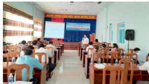
Tổ chức các lớp tập huấn về chính sách khuyến công