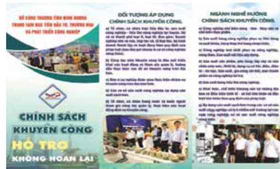
Tờ rơi tuyên truyền

Một số hình ảnh tiêu biểu về kênh tuyên truyền chính sách khuyến công: