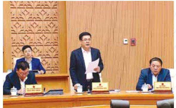
Bộ trưởng Bộ Công Thương – Nguyễn Hồng Diên phát biểu trong phiên họp Chính phủ thường kỳ tháng 2/2023

Về tái cơ cấu ngành năng lượng: tập trung phát triển ngành năng lượng nhanh, bền vững và đi trước một bước so với phát triển kinh tế xã hội. Đảm bảo vững chắc an ninh năng lượng quốc gia.