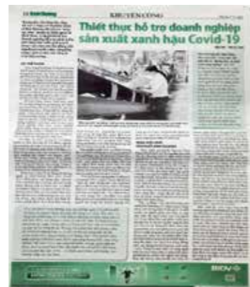
Tuyên truyền công tác khuyến công trên Báo Bình Dương