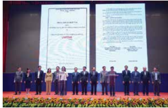
Lễ ký kết các bản ghi nhớ (MOU) hợp tác, hỗ trợ xây dựng Đề án “Phát triển dịch vụ logistics”

Trong hội nhập kinh tế quốc tế: tập trung đẩy mạnh hội nhập kinh tế quốc tế gắn với thực hiện chuyển đổi mô hình tăng trưởng, tái cấu trúc nền kinh tế theo hướng củng cố các nền tảng kinh tế vĩ mô, tăng cường nội lực của nền kinh tế; lấy doanh nghiệp trong nước là trọng tâm để hợp tác, hội nhập và ứng phó linh hoạt, hiệu quả với các cú sốc bất lợi từ bên ngoài. Thực hiện hội nhập kinh tế có trọng tâm, trọng điểm theo hướng ưu tiên hợp tác quốc tế chuyển giao công nghệ hiện đại, công nghệ xanh, thúc đẩy phát triển các ngành, lĩnh vực công nghiệp công nghệ cao, các ngành, lĩnh vực ưu tiên của Việt Nam như công nghiệp năng lượng, chế biến sâu nông - lâm thủy sản, điện tử, công