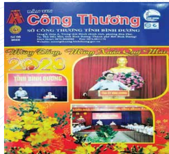
Các bài viết về khuyến công được in trên Bản tin Công Thương

Giới thiệu, quảng bá và liên kết các sản phẩm công nghiệp nông thôn tiêu biểu nhằm tìm kiếm đối tác kinh doanh đảm bảo cho các ngành phát triển theo đúng định hướng chung của tỉnh. Thực hiện tốt công tác tuyên truyền sẽ tạo được nhận thức sâu rộng trong cộng đồng doanh nghiệp, cơ sở CNNT về các chế độ chính sách của Nhà nước. Đồng thời triển khai các nội dung hoạt động khuyến công thuận lợi và đạt hiệu quả hơn. Góp phần thúc đẩy sự phát triển CNNT cũng như góp phần vào quá trình tạo ra hàng hóa cho xã hội, đóng góp cho ngân sách Nhà nước, giải quyết việc làm, tạo thu nhập cho người lao động, góp phần vào quá trình phát triển kinh tế nông thôn./.