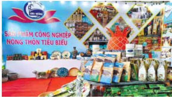
Công tác bình chọn và hội chợ triển lãm giúp nâng cao chất lượng sản phẩm và kết nối tiêu thụ

lực, thúc đẩy phát triển sản xuất công nghiệp-tiểu thủ công nghiệp; khuyến khích chuyển giao, ứng dụng khoa học công nghệ nhằm nâng cao hiệu quả phát triển bền vững, thúc đẩy hoạt động kết nối giao thương các sản phẩm công nghiệp nông thôn và hình thành các sản phẩm, nhóm sản phẩm có sức cạnh tranh cao, đáp ứng nhu cầu thị trường, đặc biệt là thị trường xuất khẩu.