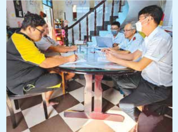
Thanh tra chuyên ngành về khí Amoniac (NH3) tại cơ sở sản xuất nước đá

Theo đó, Chủ tịch Ủy ban nhân dân tỉnh Bình Dương yêu cầu Thủ trưởng các cơ quan, đơn vị, địa phương tập trung thực hiện tốt 05 nội dung sau: