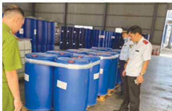
Đoàn kiểm tra thực tế tại nơi sản xuất, kinh doanh, nhà xưởng, kho chứa hàng hóa của doanh nghiệp

Đây là kết quả phối hợp kiểm tra trong hoạt động hóa chất, Sở Công Thương sẽ tiếp tục tham gia phối hợp với các ngành chức năng kiểm tra đột xuất đối với các doanh nghiệp hoạt động hóa chất trên địa bàn tỉnh Bình Dương./.