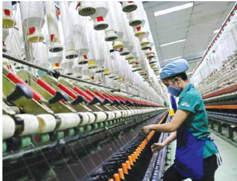
Hình minh họa

T hủ tướng Chính phủ định hướng phát triển ngành Dệt may, Da giày theo hướng chuyên môn hoá, hiện đại hóa; cải thiện cơ cấu sản phẩm, tập trung phát triển các sản phẩm có giá trị gia tăng cao; áp dụng các tiêu chuẩn, quy chuẩn quản lý chất lượng tiên tiến để nâng cao sức cạnh tranh của ngành Dệt may và Da giày Việt Nam; đẩy mạnh chuyển từ gia công sản xuất sang các hình thức đòi hỏi năng lực cao hơn về quản lý chuỗi cung ứng, chuỗi giá trị, thiết kế và xây dựng thương hiệu trên cơ sở công nghệ phù hợp đến hiện đại gắn với hệ thống quản lý chất lượng, quản lý lao động và bảo vệ môi trường theo chuẩn mực quốc tế; thúc đẩy đầu tư sản xuất nguyên, phụ liệu, công nghiệp hỗ trợ ngành Dệt may, Da giày; chú trọng đến sản xuất vải, vải nhân tạo, da thuộc, khuyến khích sản xuất vải từ sợi sản xuất trong nước.