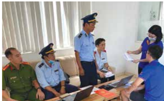
Đoàn kiểm tra công bố quyết định kiểm tra tại doanh nghiệp

nhóm 1,2 (số lượng 04 người là giám đốc, phó giám đốc, cán bộ kỹ thuật phụ trách hoạt động sản xuất hóa chất có danh sách kèm theo).