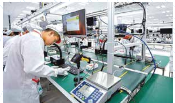
Tái cơ cấu ngành công nghiệp, kết hợp hài hòa giữa phát triển công nghiệp theo cả chiều rộng và chiều sâu

Về tái cơ cấu lĩnh vực xuất nhập khẩu: tập trung ưu tiên phát triển xuất khẩu các mặt hàng có quy mô xuất khẩu lớn, lợi thế cạnh tranh cao (điện tử, dệt may, da giày, nông sản, đồ gỗ...) gắn với đa dạng hóa và nâng cao chất lượng sản phẩm xuất khẩu. Gia tăng tỷ trọng xuất khẩu hàng hóa có hàm lượng chế biến sâu, công nghệ cao, có giá trị gia tăng cao, tỷ lệ nội địa hoá lớn, đáp ứng tiêu chuẩn cao về chất lượng và phát triển bền