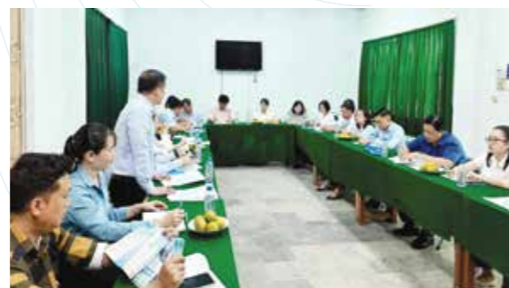
Tuyên truyền chính sách KC thông qua mạng lưới CTV