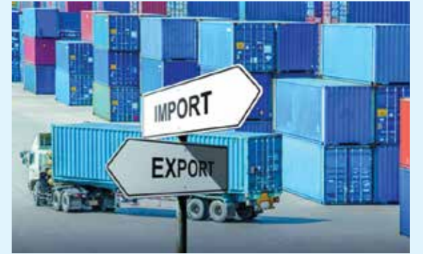
Hình ảnh minh họa

Hạn ngạch thuế quan nhập khẩu thuốc lá nguyên liệu được phân giao cho thương nhân