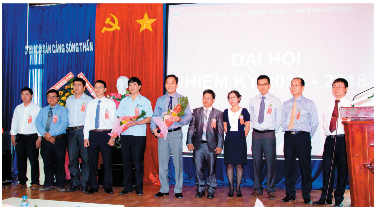
Một số thành viên ban chấp hành Hội nhiệm kỳ 2015 - 2018

Được sự quan tâm tạo điều kiện giúp đỡ của VCCI HCM, Sở Công Thương, Sở Nội vụ, Cục Hải quan và các cơ quan ban