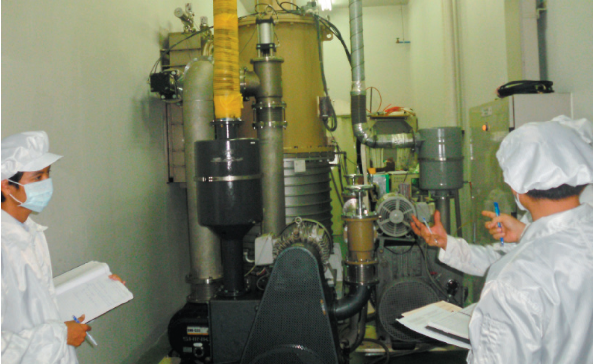
Chuyên gia thực hiện đánh giá nhanh sản xuất sạch hơn tại nhà máy

hiện đánh giá sản xuất sạch hơn tại doanh nghiệp đặc trưng của một số ngành, từ đó có rất nhiều doanh nghiệp quan tâm đã tự thực hiện được quy trình đánh giá sản xuất sạch hơn cơ bản như: Khởi động, phân tích các công đoạn sản xuất, phát triển các cơ hội sản xuất sạch hơn, lựa chọn các giải pháp sản xuất sạch hơn, thực hiện các giải pháp sản xuất sạch hơn, duy trì sản xuất sạch hơn... thiết thực mang lại hiệu quả đáng kể cho doanh nghiệp.