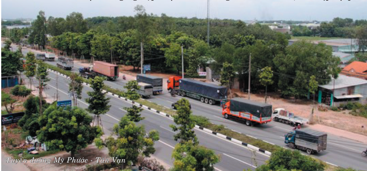
Tuyến đường Mỹ Phước - Tân Vạn

thành lập góp phần đáp ứng nhu cầu về mặt bằng sản xuất cho các nhà đầu tư vào Bình Dương với địa điểm và diện tích phù hợp, thu hút được một số lượng đáng kể lao động; góp phần thu hút đầu tư phát triển công nghiệp, tiểu thủ công nghiệp, đáp ứng nhu cầu di dời các cơ sở sản xuất gây ô nhiễm ra khỏi khu dân cư, thuận tiện cho việc xử lý ô nhiễm môi trường. Hệ thống các siêu thị, trung tâm thương mại trên địa bàn tỉnh không ngừng được đầu tư, nâng cấp và phát triển, góp phần hình thành môi trường kinh doanh hiện đại, tiên tiến tại các thành phố, thị xã; bên cạnh đó các chợ truyền thống cũng không ngừng được nâng cấp, chỉnh trang; chợ nông thôn được quan tâm, đầu tư. Các thành phần kinh tế tham gia đầu tư vào lĩnh vực chợ, siêu thị, trung tâm thương mại ngày càng tăng, cơ sở vật chất được đầu tư kiên cố, số lượng cũng như chủng loại hàng hoá phục vụ người tiêu dùng thông qua mạng lưới bán lẻ này ngày càng phong phú và đa dạng, đáp ứng ngày càng tốt hơn cho nhu cầu của người dân. Mạng lưới kinh doanh xăng dầu, LPG được quy hoạch, phát triển kịp thời, đáp ứng nhu cầu tiêu dùng của nhân dân, bắt kịp sự phát