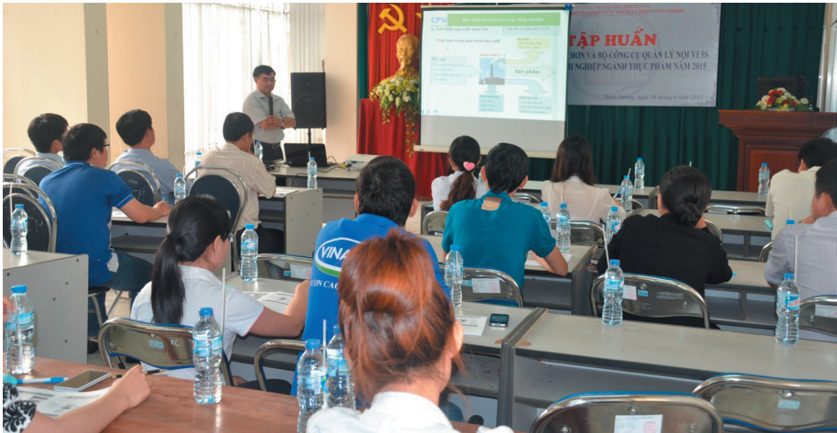
Tập huấn sản xuất sạch hơn

Nâng cao hiệu quả tuyên truyền, phổ biến kiến thức về sản xuất sạch hơn trong công nghiệp, đồng thời giới thiệu thông tin về chủ trương, chính sách pháp luật của Nhà nước khuyến khích sản xuất bền vững, chống biến đổi khí hậu và đặc biệt là chương trình hỗ trợ thiết thực từ Ủy ban nhân dân tỉnh Bình Dương.