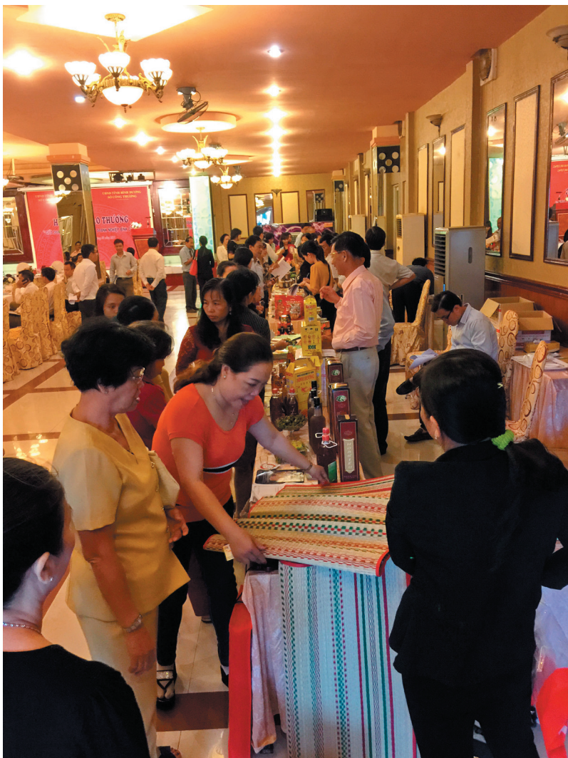
Hội nghị Giao thương giữa doanh nghiệp Bình Dương và An Giang

Đồng thời, Sở luôn quan tâm, chỉ đạo ngành điện đảm bảo nguồn điện ổn định, đủ nhu cầu công suất sử dụng cho