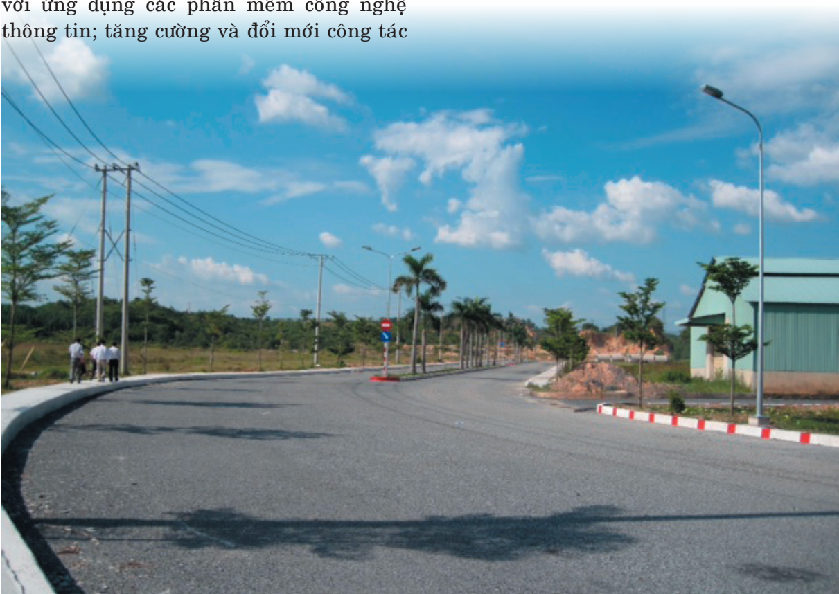
Tuyến đường trong cụm công nghiệp Tân Mỹ được hỗ trợ kinh phí khuyến công quốc gia