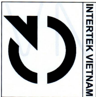
Hình dạng, kích thước cơ bản của dấu hợp quy "CR"

- Khi Intertek Việt Nam phát hiện Doanh nghiệp vi phạm về sử dụng Giấy chứng nhận và dấu hợp