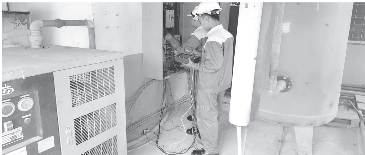
Thực hiện KTNL tại nhà máy

Số lượng doanh nghiệp tham gia KTNL được trải đều trên các ngành như: Thép, dệt - may, giày - da, giấy, nhựa, gốm sứ, gỗ... qua đó cho thấy sự đa dạng về ngành nghề đăng ký tham gia KTNL đồng thời thể hiện sự hiệu quả trong công tác tuyên