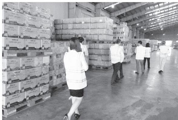
Đoàn thẩm định cơ sở đủ điều kiện ATTP tại Chi nhánh Bình Dương - Công ty cổ phần Vinacafé Biên Hòa

T hực hiện uỷ quyền của Bộ Công Thương (Vụ Thị trường trong nước) về việc thẩm định thực tế cơ sở đủ điều kiện an toàn thực phẩm của Chi nhánh Bình Dương - Công ty cổ phần Vinacafé Biên Hòa và Chi nhánh công ty cổ phần nước khoáng Vĩnh Hảo tại Bình Dương, ngày 27/3/2017, Sở Công Thương đã ra Quyết định số 39/QĐ-SCT về việc thành lập Đoàn thẩm định điều kiện an toàn thực phẩm đối với cơ sở kinh doanh thực phẩm của Chi nhánh Bình Dương - Công ty cổ phần Vinacafé Biên Hòa và Quyết định số 38/QĐ-SCT về việc thành lập Đoàn thẩm định điều kiện an toàn thực phẩm đối với cơ sở kinh doanh thực phẩm của Chi nhánh công ty cổ phần nước khoáng Vĩnh Hảo tại Bình Dương.