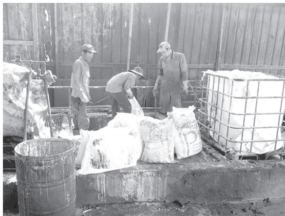
Hình thức tiêu hủy các mặt hàng thực phẩm kém chất lượng được xé đổ xuống bể

Trong đợt tiêu hủy này, Chi cục Quản lý thị trường tỉnh Bình Dương cũng đã tiêu hủy tổng cộng 22 danh mục với 3.139,1