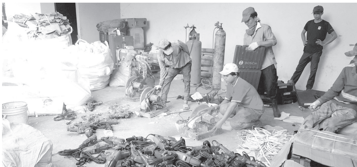
Hình ảnh tiêu hủy máy khoan, linh kiện điện giả nhãn hiệu