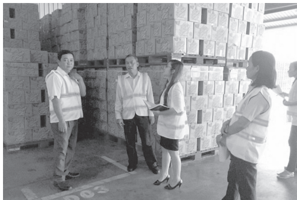
Đoàn thẩm định cơ sở đủ điều kiện ATTP Chi nhánh công ty cổ phần nước khoáng Vĩnh Hảo tại Bình Dương