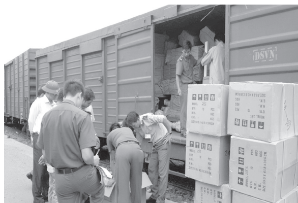
Các lực lượng chức năng phối hợp kiểm tra hàng hóa tại ga Sóng Thần

- Trong quá trình thực hiện chức năng, nhiệm vụ, trách nhiệm được Chủ tịch UBND tỉnh và Ban Chỉ đạo 389 tỉnh giao, Thủ trưởng các sở, ngành, và Chủ tịch UBND các huyện, thị xã, thành phố có trách nhiệm chỉ đạo các lực lượng chức năng thuộc quyền chủ động tổ chức việc phối hợp hoạt động, trong đó có phân định cơ quan chủ trì và cơ quan phối hợp để đảm bảo tính thống nhất, đồng bộ trong