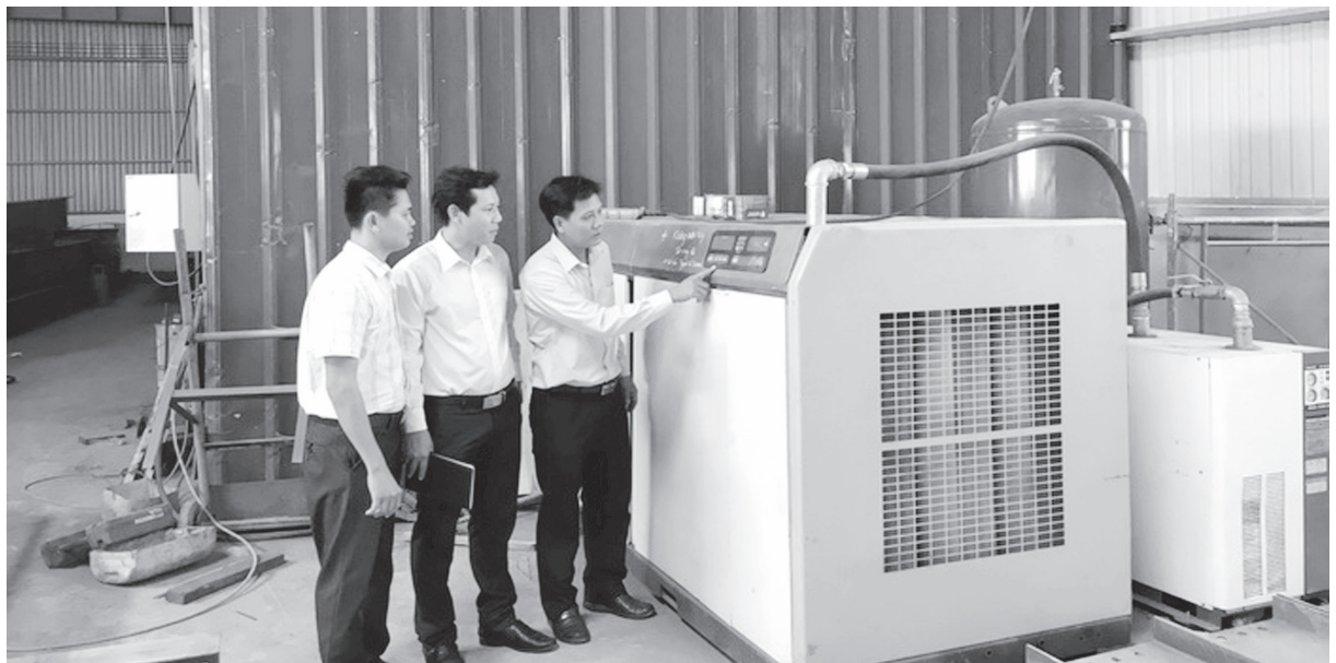
Máy nén khí công suất 100HP (75kW) được đầu tư mới

- Lắp đặt tụ bù hạ thế, nâng cao hệ số công suất \cos\phi giúp giảm được lượng