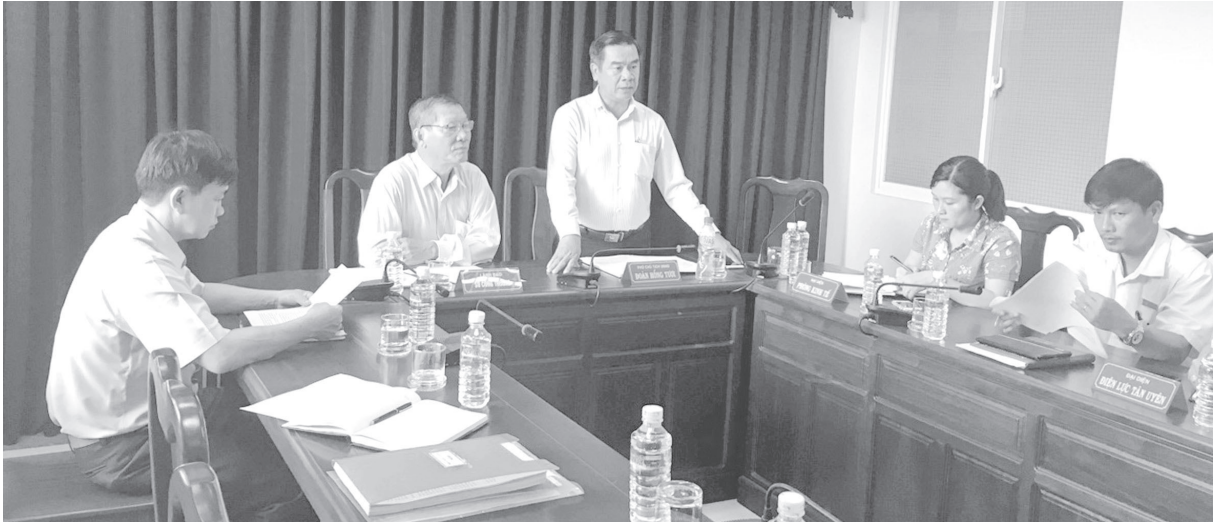
Làm việc với UBND huyện Phú Giáo

công lập và chỉ đạo của UBND tỉnh Bình Dương tại công văn số 645/UBND-KTN ngày 18/3/2013 về việc tiếp tục chỉ đạo thực hiện Thông tư Liên tịch số 111/2009/TTLT/BTC-BCT của Bộ Tài Chính và Bộ Công Thương, còn nhiều đơn vị đóng trên địa bàn thị xã Tân Uyên chưa đăng ký phương án sử dụng điện, kết quả đăng