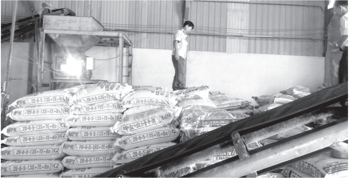
Kiểm tra tại công ty vật tư nông nghiệp Thiên Phúc Hưng

Thực tế qua kiểm tra trong năm 2016 cho thấy đa số các doanh nghiệp hoạt động sản xuất, kinh doanh và nhập khẩu phân bón vô cơ trên địa bàn tỉnh có ý thức chấp hành tốt pháp luật về hoạt động phân bón. Tuy nhiên vẫn còn một số doanh nghiệp chấp hành pháp luật chưa nghiêm trong hoạt động sản xuất, kinh doanh và nhập khẩu phân bón vô cơ. Cụ thể như: