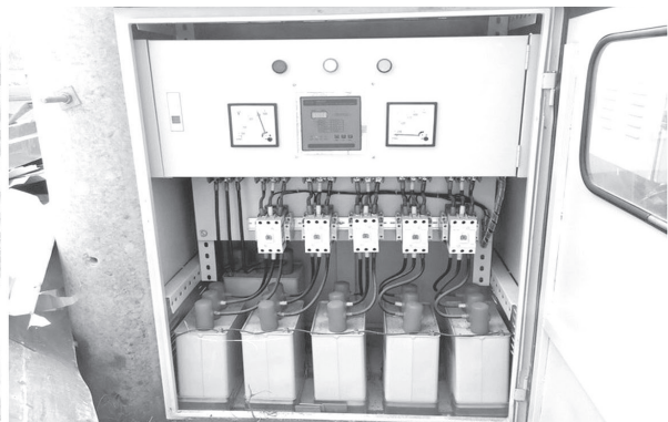
Tận dụng ánh sáng tự nhiên và lắp đặt tủ tụ bù công suất phản kháng

điện năng tổn thất trên hệ thống truyền tải từ trạm biến áp đến tủ phân phối, giảm điện năng tổn hao cho máy biến áp đang hoạt động non tải. Hàng năm tiết kiệm được 4,3 triệu đồng.