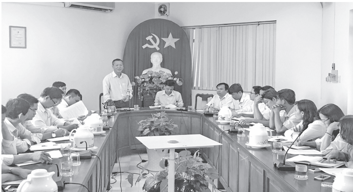
Làm việc với UBND thị xã Thuận An

Việc thực hiện Thông tư liên tịch số 111/2009/TTLT/BTC-BCT ngày 01/6/2009 của Bộ Tài Chính và Bộ Công Thương hướng dẫn thực hiện tiết kiệm điện trong các cơ quan nhà nước, đơn vị sự nghiệp