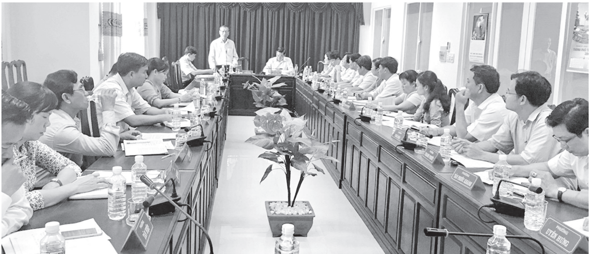
Làm việc với UBND thị xã Tân Uyên

Các trường hợp vi phạm thu giá điện nhà trọ đều được nhắc nhở và đề