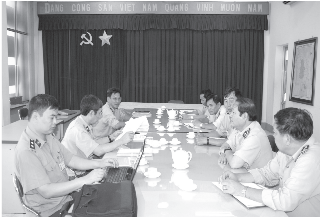
Lãnh đạo Chi cục Quản lý thị trường tiếp đoàn kiểm tra

tỉnh Bình Dương một mặt phản ánh kịp thời những vướng mắc về Cục, một mặt khắc phục khó khăn để chấp hành nghiêm qui định của Luật và các văn bản quy phạm pháp luật có liên quan. Vì vậy, công tác xử phạt vi phạm hành chính của Chi cục đã được thực hiện nghiêm túc, đúng theo quy định của pháp luật. Các trường hợp vi phạm được phát hiện, lập biên bản kịp thời và ban hành quyết định xử phạt đúng đối tượng, đúng thẩm quyền, đúng trình tự, thủ tục theo quy định, góp phần tạo sự chuyển biến mạnh mẽ về ý thức chấp hành pháp luật của các tổ chức