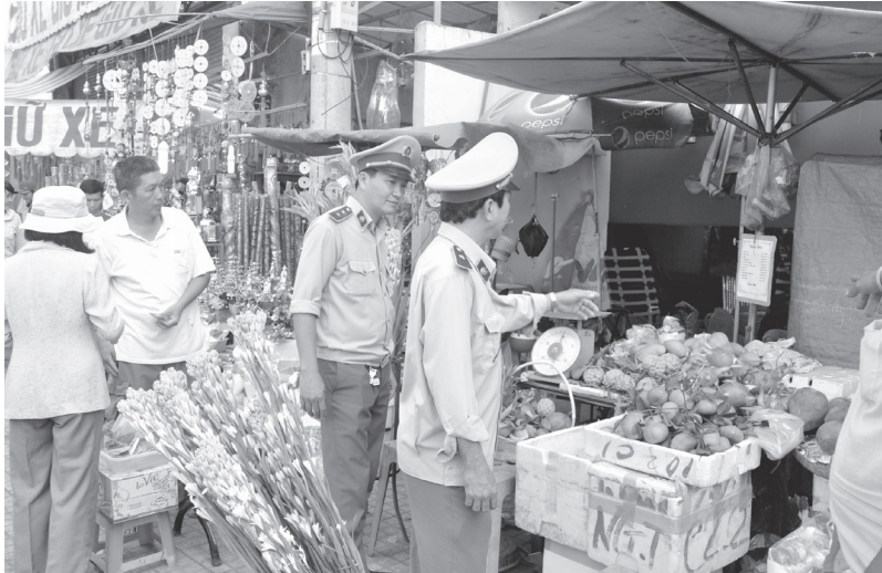
Lực lượng Quản lý thị trường kiểm tra, nhắc nhở việc niêm yết giá trong dịp lễ hội chùa Bà

- Trong các ngày 19/12/2014, 23/12/2014 và 29/01/2015 Chi cục QLTT phối hợp Phòng Cảnh sát Điều tra tội phạm về trật tự quản lý kinh tế và chức vụ (PC46) Công an Bình Dương tiến hành kiểm tra hàng hóa vận chuyển trên Tàu hỏa Bắc-Nam tại bãi hàng An Bình, phường An Bình, thị xã Dĩ An, tỉnh Bình Dương (Ga Sóng Thần). Tạm giữ: 110 bộ linh kiện lắp ráp 110 xe ba gác máy, 2.000 đầu thu kỹ thuật số; 340 các micro không dây, 1.800 bộ màn sáo, 28.000 bóng đèn Led, 5.500 cái quần áo lót và nhiều hàng hóa khác do không xuất trình được hóa đơn chứng từ chứng minh nguồn gốc hợp pháp với tổng giá trị hàng hóa vi phạm lên đến hàng tỷ đồng. Sau khi tổ chức xác minh làm rõ, toàn bộ số hàng nêu trên và nhiều hàng hóa khác có nguồn gốc nhập lậu, Chi cục đang