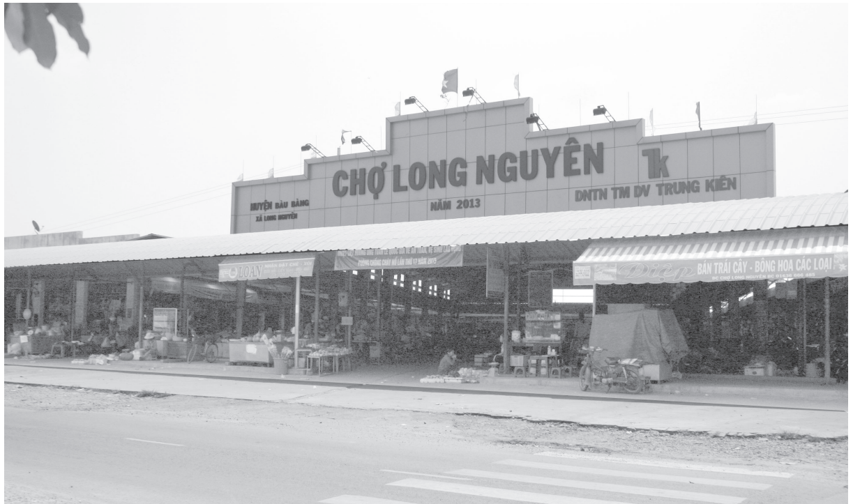
Chợ nông thôn mới tại xã Long Nguyên, Bàu Bàng

số tiền bảo hiểm là 12.062.000.000 đồng. Trong đó, có 20 hộ nghèo (138 con heo), 15 hộ cận nghèo (107 con heo, 1 bò sữa), 40 hộ không thuộc diện nghèo cận nghèo (1.605 con heo). Tổng phí bảo hiểm là 359.535.000 đồng, trong đó: Nhà nước hỗ trợ 231.500.000 triệu đồng.