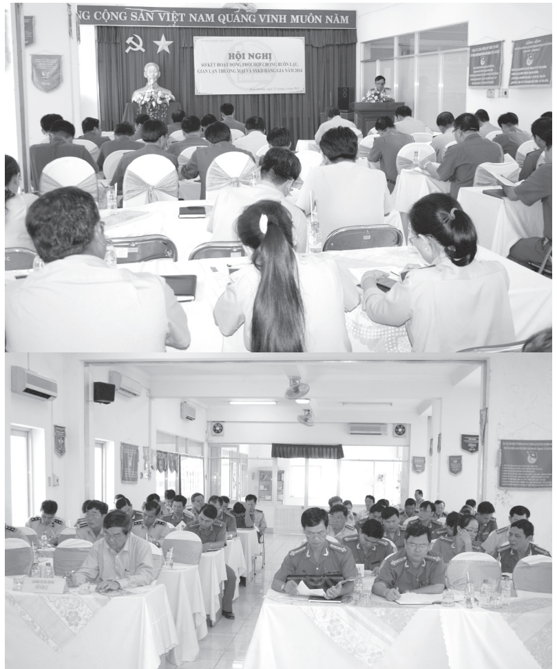
Hội nghị sơ kết công tác phối hợp chống buôn lậu năm 2014 của Sở Công Thương và Công an tỉnh

Chi cục QLTT và Công an kinh tế, Công an các huyện, thị, thành phố đã triển khai thực hiện nghiêm Quy chế phối hợp. Tác cả các đội QLTT và đội Cảnh sát Kinh tế – Công an các huyện, thị, thành