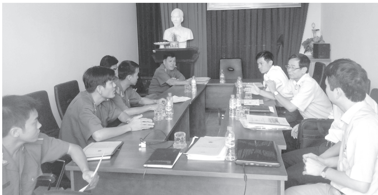
Đoàn kiểm tra tại Chi nhánh Công ty TNHH MTV Công nghiệp hóa chất mỏ Nam Bộ - Micco tại Bình Dương

Xác định Vật liệu nổ công nghiệp là loại hàng hóa đặc biệt, việc sử dụng vật liệu nổ công nghiệp không đúng theo các quy định về tiêu chuẩn an toàn sẽ dẫn đến tính mạng, tài sản và ảnh hưởng phức tạp tình hình an ninh chính trị, trật tự an toàn xã hội của địa phương. Do đó các văn bản qui phạm pháp luật về Vật liệu nổ công nghiệp được ban hành kịp thời, đầy đủ đã tạo điều kiện cho công tác quản lý