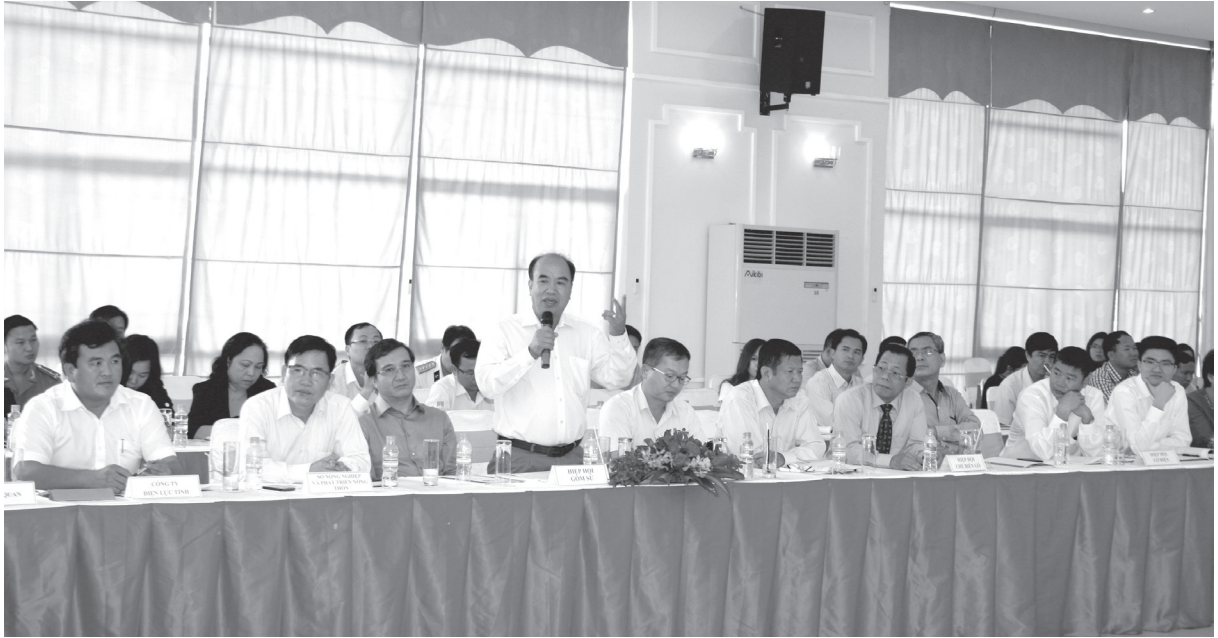
Đại diện hiệp hội gồm sứ phát biểu trong buổi gặp gỡ, tiếp xúc với lãnh đạo UBND tỉnh

- Thị trường xuất khẩu chủ yếu của các doanh nghiệp gồm sứ là Mỹ và EU, cụ thể: