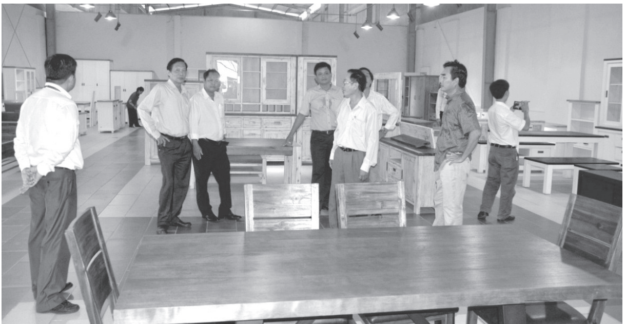
Đoàn công tác tham quan thực tế tại Công ty TNHH Nguyễn Thanh