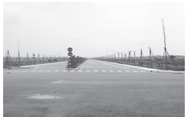
Cơ sở hạ tầng tại cụm công nghiệp Phú Chánh