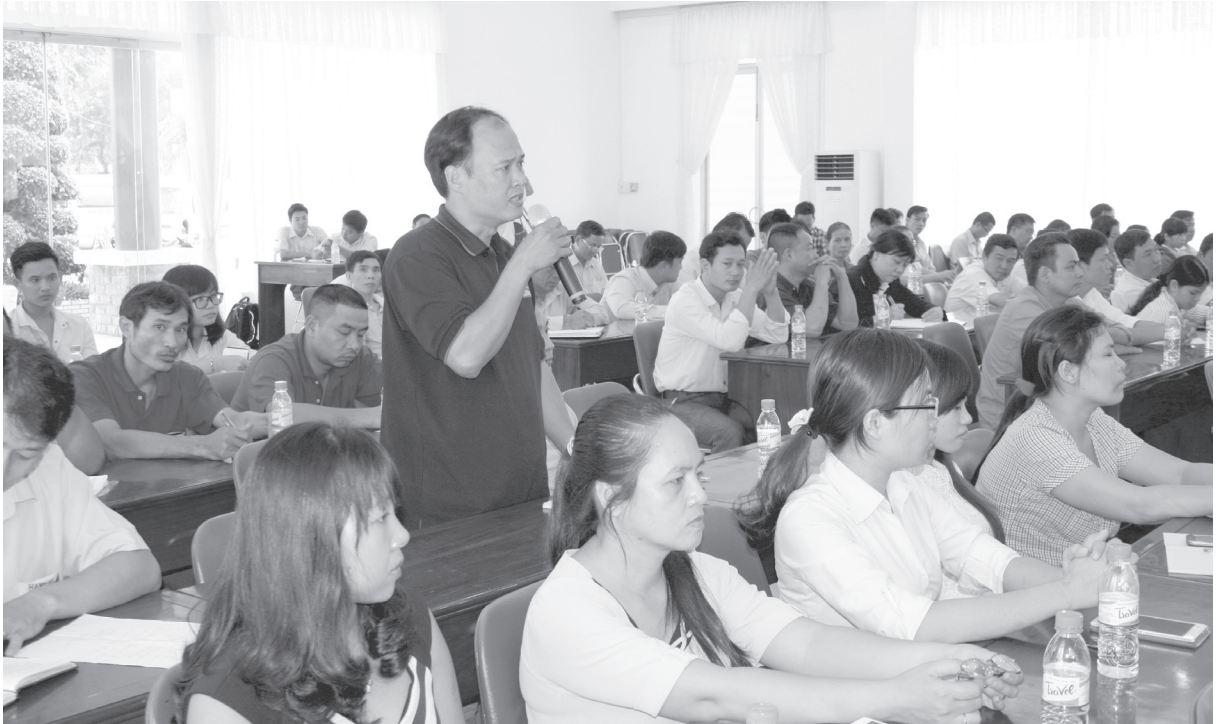
Đại diện Công đoàn và người lao động tại các doanh nghiệp đặt câu hỏi với lãnh đạo tỉnh, các Sở ngành và thị xã Dĩ An.