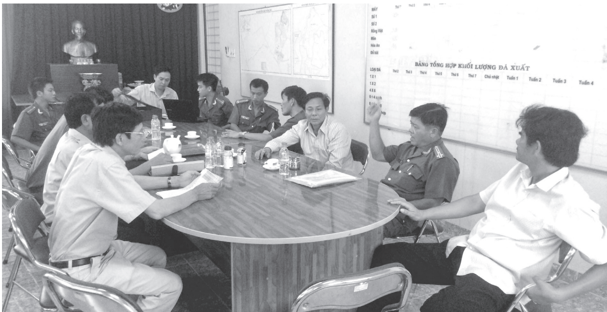
Đoàn kiểm tra tại mỏ đá Tân Mỹ của Công ty cổ phần Khoáng sản và Xây dựng Bình Dương